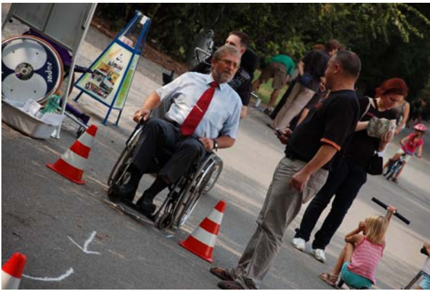
Pan ředitel „úrazovky“ na slalomu